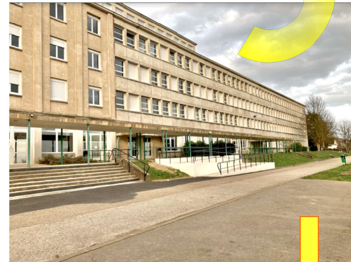
© Lycée Louis DAVIER - Bureau des Entreprises - Janvier 2026

Soutien Activités Pédagogie Organisation